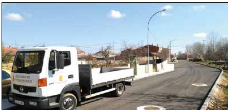
El vehículo municipal trabajando en las obras de asfaltado de las calles de Pinilla

El procedimiento de adjudicación ha sido mediante licitación pública con total transparencia. El importe invertido asciende a 15.900€.