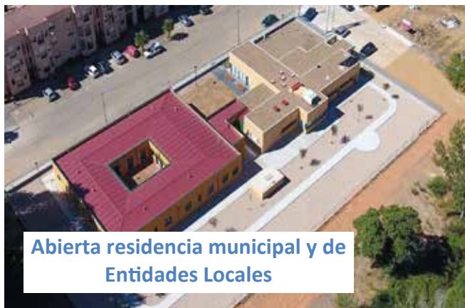
Abierta residencia municipal y de Entidades Locales