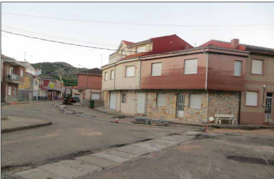
Torneros de la Valdería: Obras de Renovación de la red de abastecimiento de aguas y alcantarillado.

Las obras están subvencionadas por la Diputación de León mediante el Plan Especial de Infraestructuras 2016. No suponen coste para las arcas de las Entidades locales Menores ni para los vecinos beneficiarios de las mismas.