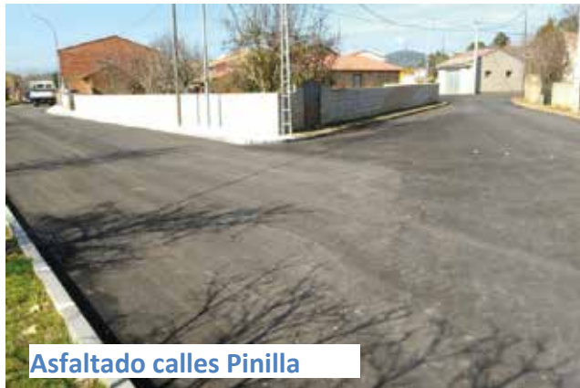
Asfaltado calles Pinilla