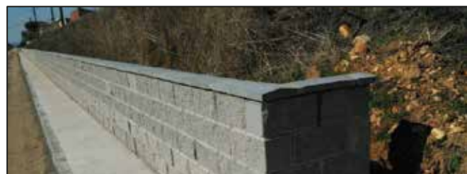
Obra de Muro de contención y acera en la travesía de la N-125 a su paso por Nogarejas a coste 0€ para Ayuntamiento