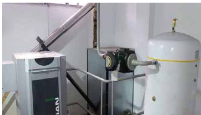
Caldera del colegio Antonio Justel después de la nueva instalación, incorporando el sistema de alimentación por pellets.

Hemos conseguido una subvención de la Diputación de León de 6.663,14 € para mejoras en el sistema de calefacción y eliminación de barreras arquitectónicas en Colegio Público Antonio Justel. La inversión total asciende a: 21.920,63 € por la caldera de pellets, 1.343,98 € para la eliminación de barreras arquitectónicas y 913,55€ en mejoras en los baños con un coste total de 24.178,06 €.