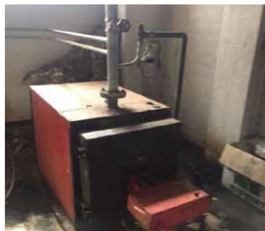
Estado de abandono de la caldera del colegio antes de la nueva instalación.