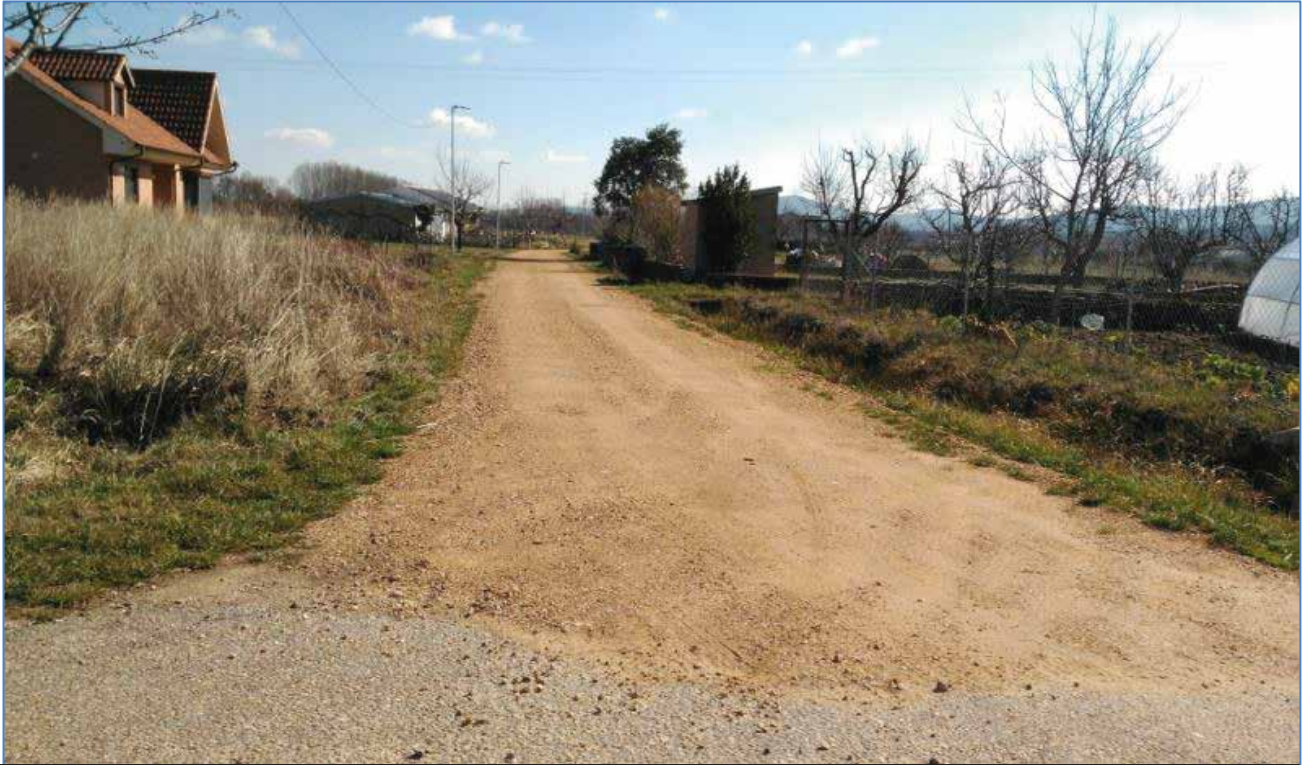
Se ha llevado a cabo una inversión en recuperación de caminos en Torneros de la Valdería.

Desde el ayuntamiento se ha hecho un esfuerzo por mejorar el firme de varios caminos en la localidad de Torneros de la Valdería que acareaban años sin recibir labores de mantenimiento y a fin de facilitar las labores agrarias de los vecinos de la localidad. La obra se contrató con una empresa de la localidad de Torneros.